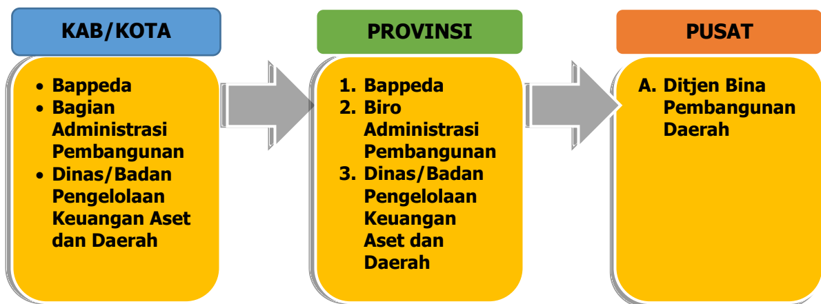
Gambar 1.1 Proses umum rancangan usulan DAK Fisik

Proses pengusulan dan verifikasi rancangan usulan program dan kegiatan pembangunan daerah melalui dana alokasi khusus fisik dilakukan secara berjenjang dari awal penginputan rancangan pengusulan kegiatan Dana Alokasi Khusus (DAK) Fisik oleh perangkat daerah sampai dengan verifikasi daerah kabupaten/kota dan daerah provinsi sampai dengan di tingkat pusat melalui Direktorat Jenderal Bina Pembangunan Daerah. Verifikasi yang dilakukan pada tiap level pemerintahan dilakukan dengan menggunakan indikator yang telah ditentukan, sehingga output verifikasi dari tiap tingkatan dapat akan berbeda sesuai dengan kebutuhan masing-masing. Proses umum verifikasi rancangan usulan program dan kegiatan pembangunan daerah melalui DAK fisik secara keseluruhan meliputi: